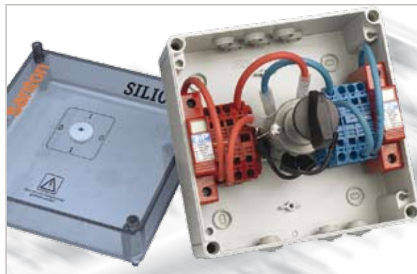
25A 1000 V DC Standard