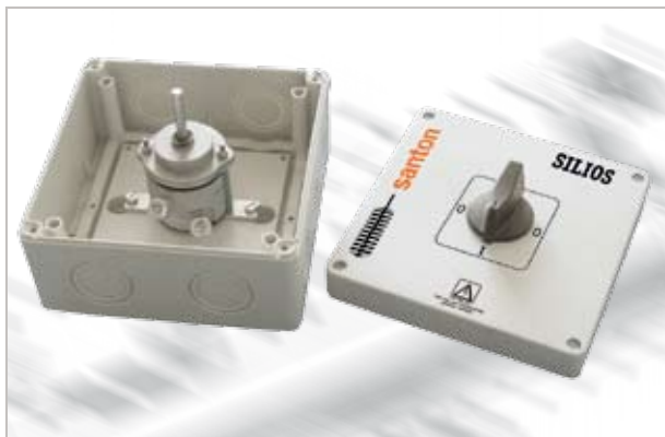
16A 500 V DC Standard